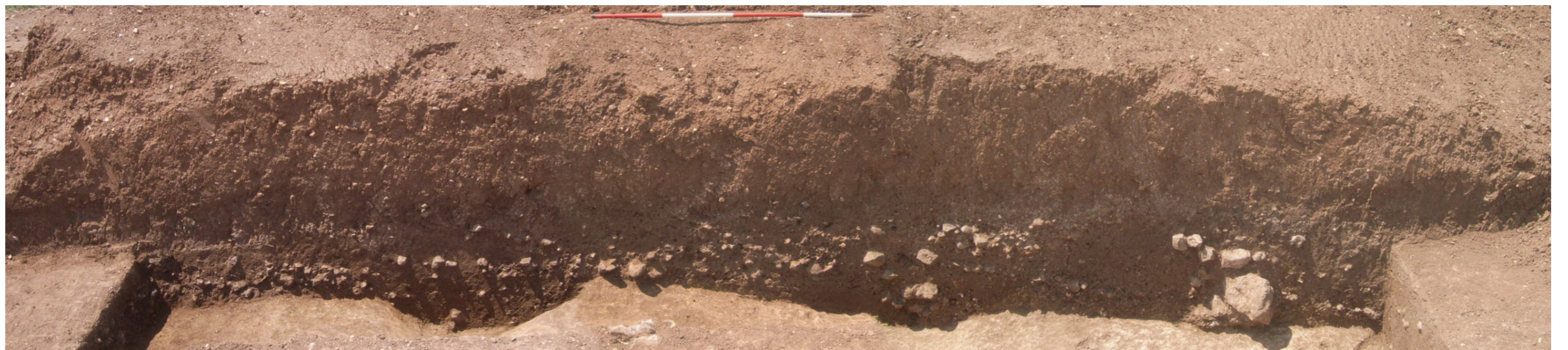
Figure 47 : reconstitution de la voie romaine (assemblée à l'aide du logiciel ArcSoft Panorama Maker) (CLR)